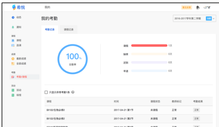
图 1 个人考勤记录

线上请假方式，学生可以登录希悦系统（网址： bdfzcz.seiue.com ）查询：登陆系统后点击左侧导航栏中的考勤/请假标签，即可查看个人考勤信息。如需为学生请假，可切换到请假记录标签，并点击请假按钮，或在首页点击每日动态右侧的请假按钮，选择学生的请假的时间与节次，标注请假的类型，并进行说明即可完成请假申请。审批后，您可以在系统内收到反馈通知，也可以随时在请假记录页面进行查询。